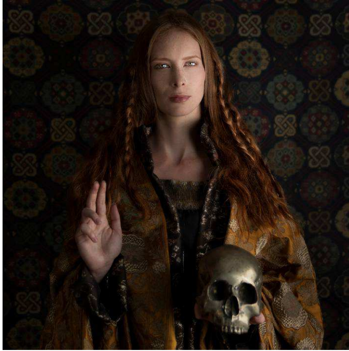
Hildegarde, série Feminae Singulares