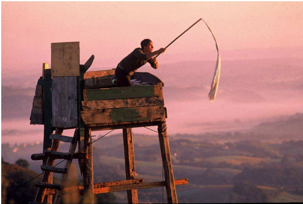
Un rabatteur, chasse à la palombe