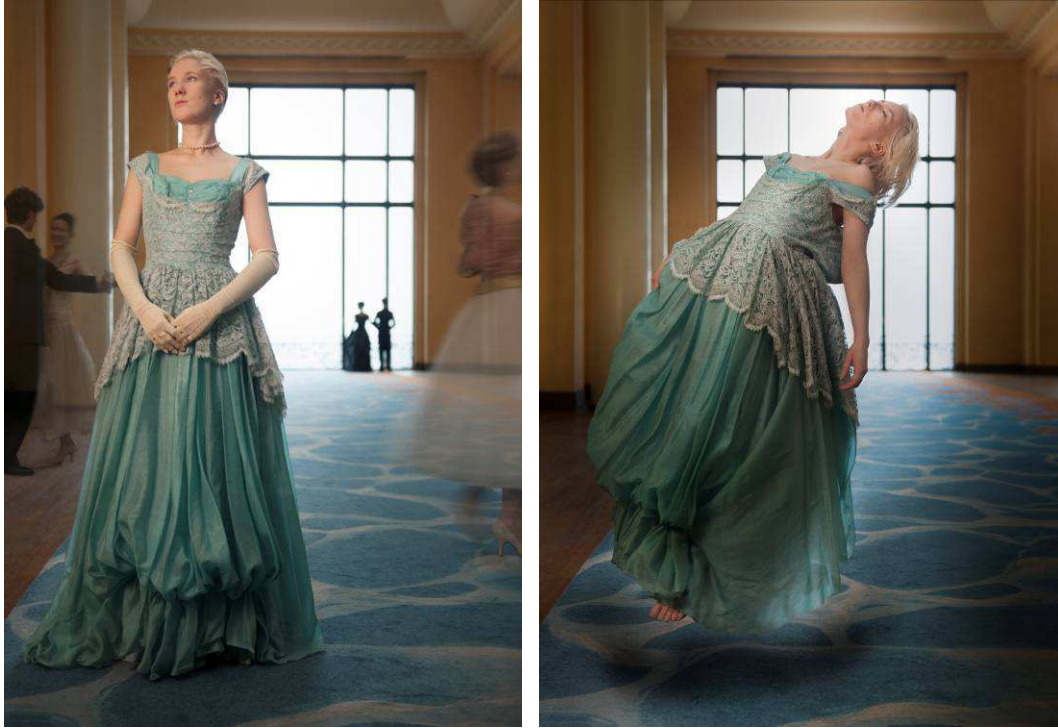
Lol V.Stein, série Héroïnes ©Anne Kuhn