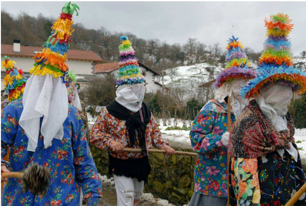
Carnaval à Lantz