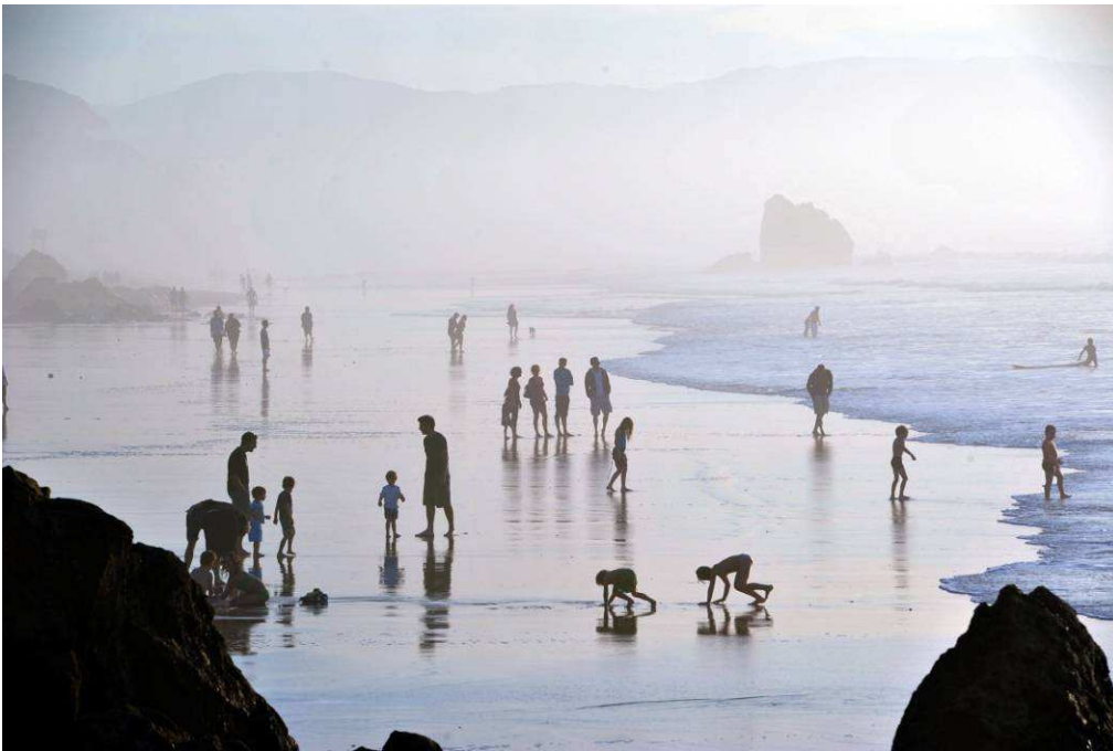
Kostaldea/Côte Basque

Ensemble, les deux amoureux du Pays basque et des mots préparent en effet pour novembre 2020 la sortie de l'ouvrage Au pays des Basques, Voyages et Histoires , où contes et récits de balades sur le territoire se mêlent aux photographies.