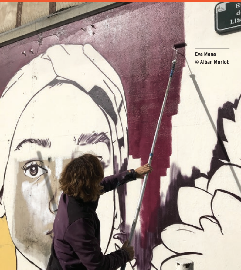
Eva Mena © Alban Morlot

Maire de Bayonne / Président de la Communauté d'agglomération Pays Basque