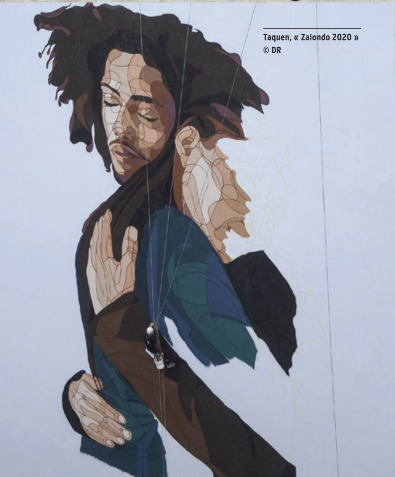
Taquen, « Zalondo 2020 »