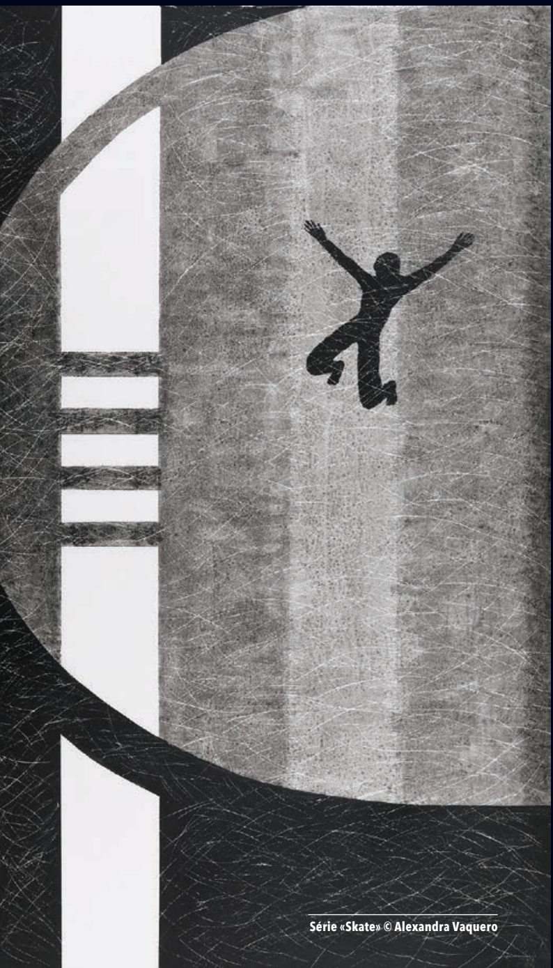
Série «Skate» © Alexandra Vaquero

Maire de Bayonne - Président de la Communauté d'agglomération Pays Basque