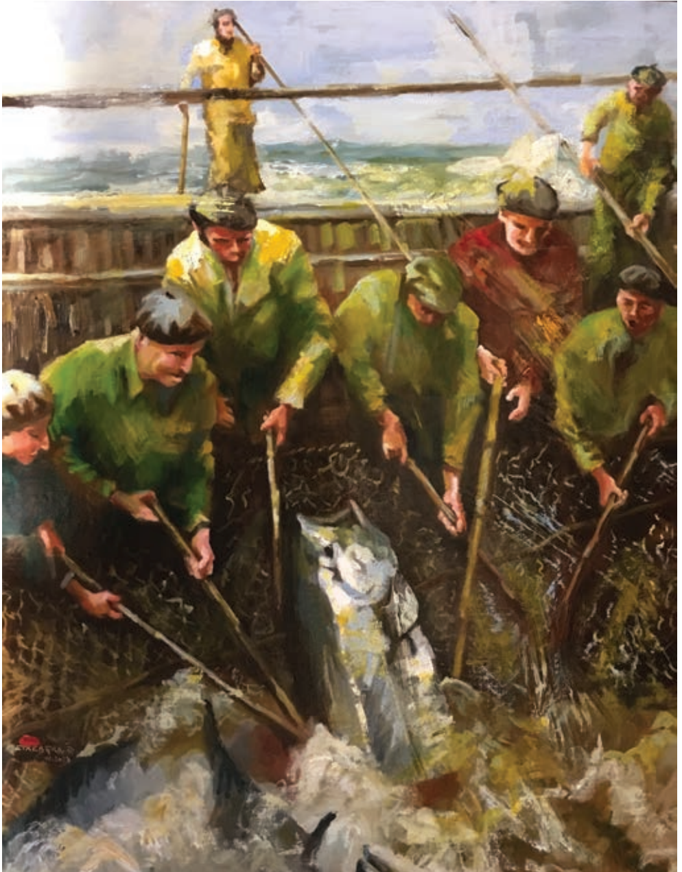
Arrantxaleak © Miguel Etxebarria