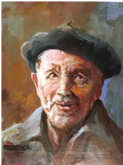
Nobleza © Miguel Etxebarria